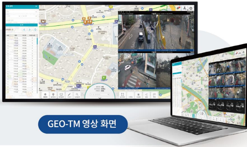
GEO-TM 영상 화면