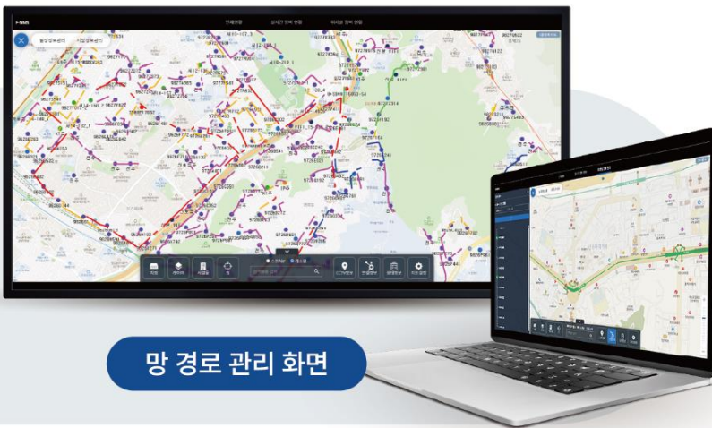
망 경로 관리 화면