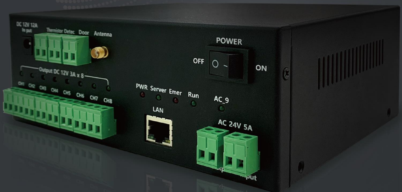
TM-SC09 Monitoring Software